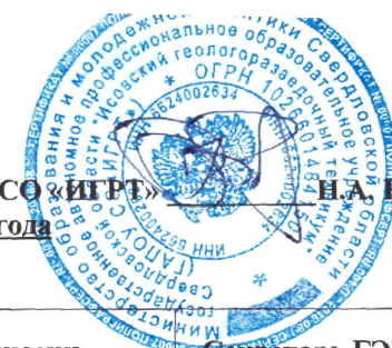
График проведения государственной итоговой аттестации